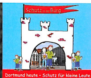
Dortmund heute - Schutz für kleine Leute